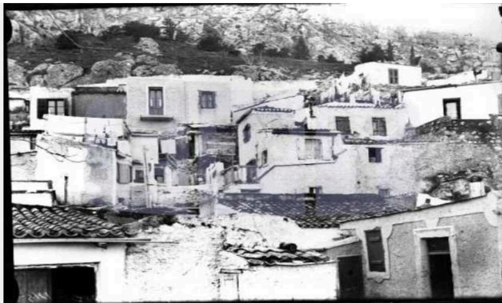
Τα Αναφιώτικα - Δεκαετία 1920