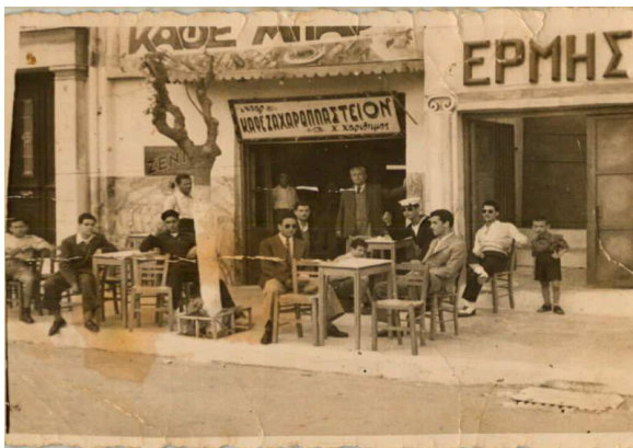
Χαρακτηριστική εικόνα της παλιάς Αθήνας

Ο τραγουδιστής με τη βελούδινη φωνή, Νίκος Γούναρης, γεννήθηκε στη Ζαγορά του Πηλίου το 1915 και μεσουράνησε τη δεκαετία του 1950 στο ελληνικό πεντάγραμμο, είτε σόλο, είτε σε συνεργασία με το Τρίο Μπελκάντο. Υπηρέτησε με συνέπεια το λεγόμενο ελαφρό τραγούδι, αυτό που πολλοί Έλληνες αποκαλούν «Ευρωπαϊκό». Η δεκαετία του '50 χαρακτηρίστηκε από τη μεγάλη κόντρα του λαϊκού και ελαφρού τραγουδιού, το οποίο ταίριαζε απόλυτα με την προσπάθεια της Ελλάδας να γίνει επιτέλους Ευρώπη, μετά τον αδελφοκτόνο εμφύλιο πόλεμο. Ο Γούναρης ήταν ο κύριος εκφραστής αυτού του είδους. Χαρακτηριστικά είναι τα λόγια του Τσιτσάνη: «Όσο υπάρχει Γούναρης δεν μπορεί το λαϊκό να σηκώσει κεφάλι». Το λαϊκό τραγούδι θα πάρει, βεβαίως, τη ρεβάνς πολύ σύντομα, τη δεκαετία του '60 και θα κυριαρχήσει ολοκληρωτικά τα επόμενα χρόνια. Ο Νίκος Γούναρης πρωτοεμφανίστηκε το 1936 και αναδείχθηκε στην Κατοχή, παράλληλα με τη συμμετοχή του στην Αντίσταση. Προσέφερε ανεκτίμητες υπηρεσίες στον αγώνα της απελευθέρωσης και για τις πράξεις του τιμήθηκε με το Αριστείο της Εθνικής Αντίστασης. Μεγάλες επιτυχίες του υπήρξαν τα τραγούδια: «Αυτός ο άλλος», «Ένα βράδυ που 'βρεχε», «Σκαλί σκαλί θα κατεβώ» και «Αρχισαν τα όργανα». Πέθανε στις 5 Μαΐου του 1965, χτυπημένος από την επάρατη νόσο.