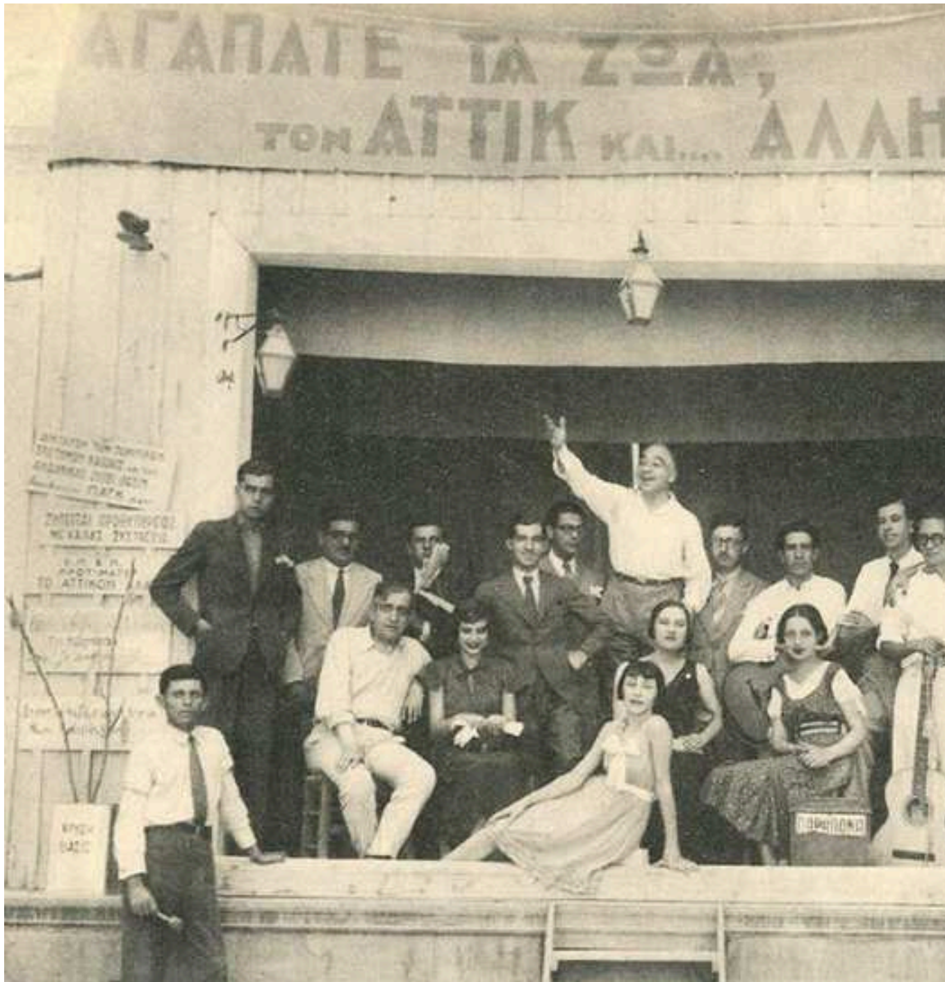
Φωτογραφία από την Μάνδρα του Αττίκ .