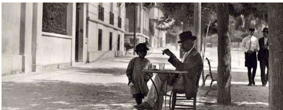
Καπέλο, σιγαρέτο και ελληνικός καφές σε ένα ήσυχο, πλατύ πεζοδρόμιο στη σκιά των δέντρων (1920)