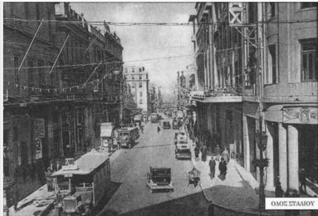
Δεκαετία 1930 - Οδός Σταδίου - Stadiou st.