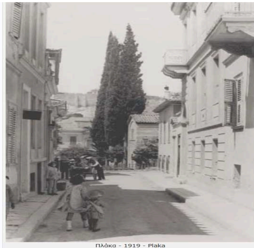
Πλάκα - 1919 - Plaka