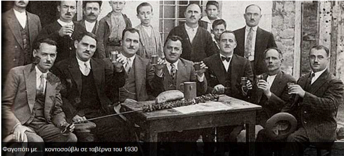
Φαγοπότι με... κοντοσουβλι σε ταβέρνα του 1930