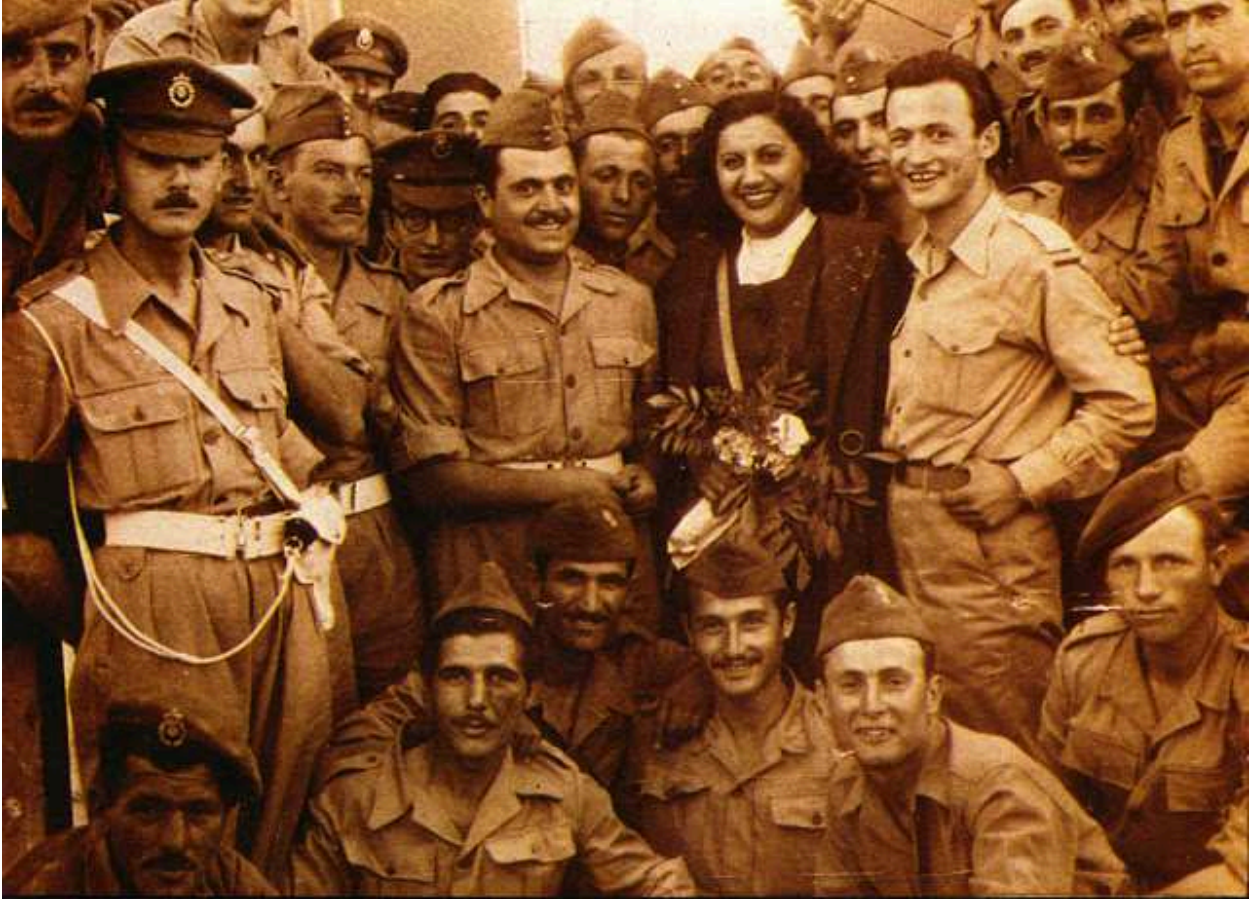
Φωτογραφία από την περιοδεία της Βέμπο στην Αίγυπτο

παραδώσει όταν η ασφάλεια χτύπησε την πόρτα της. Πέθανε στις 11 Μαρτίου του 1978 και η κηδεία της μετατρέπεται σ' ένα πάνδημο συλλαλητήριο.