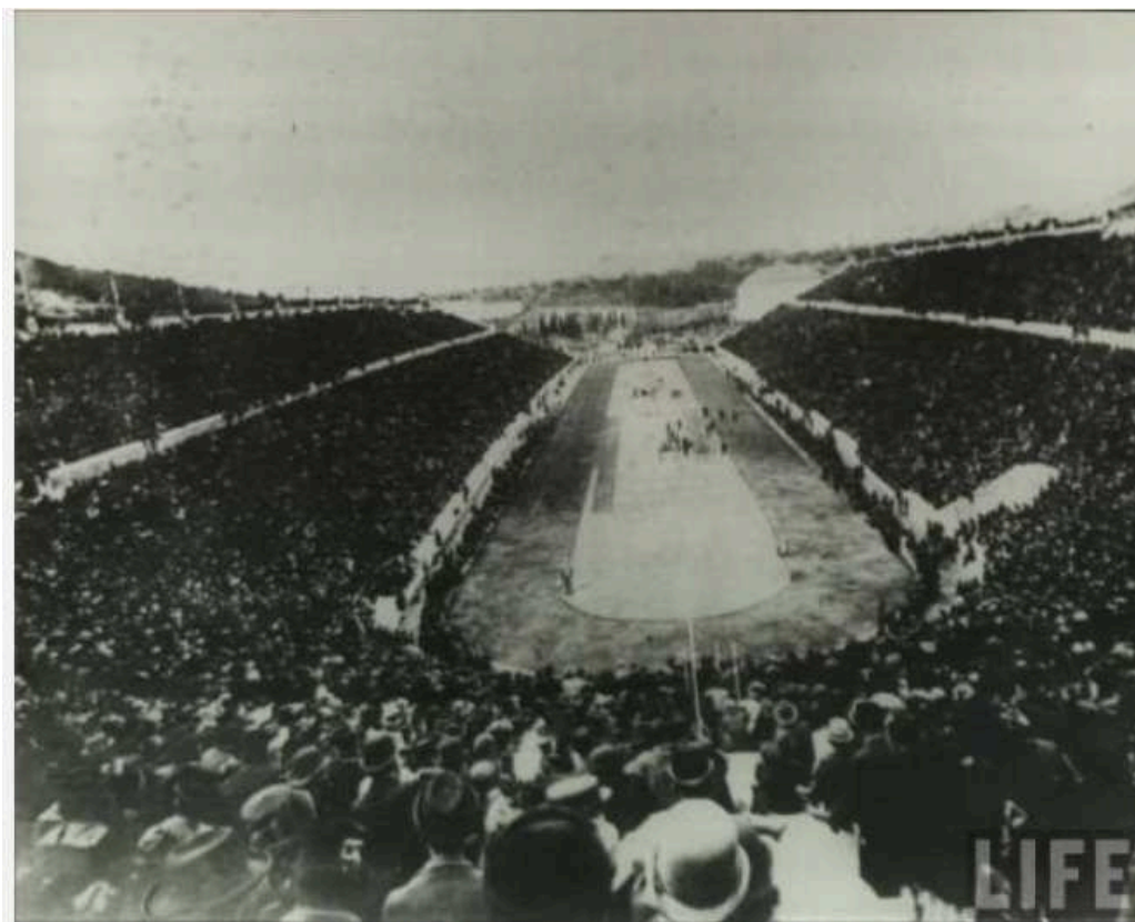
Καλλιμάχμαρο Στάδιο - Αρχές 20ου αιώνα