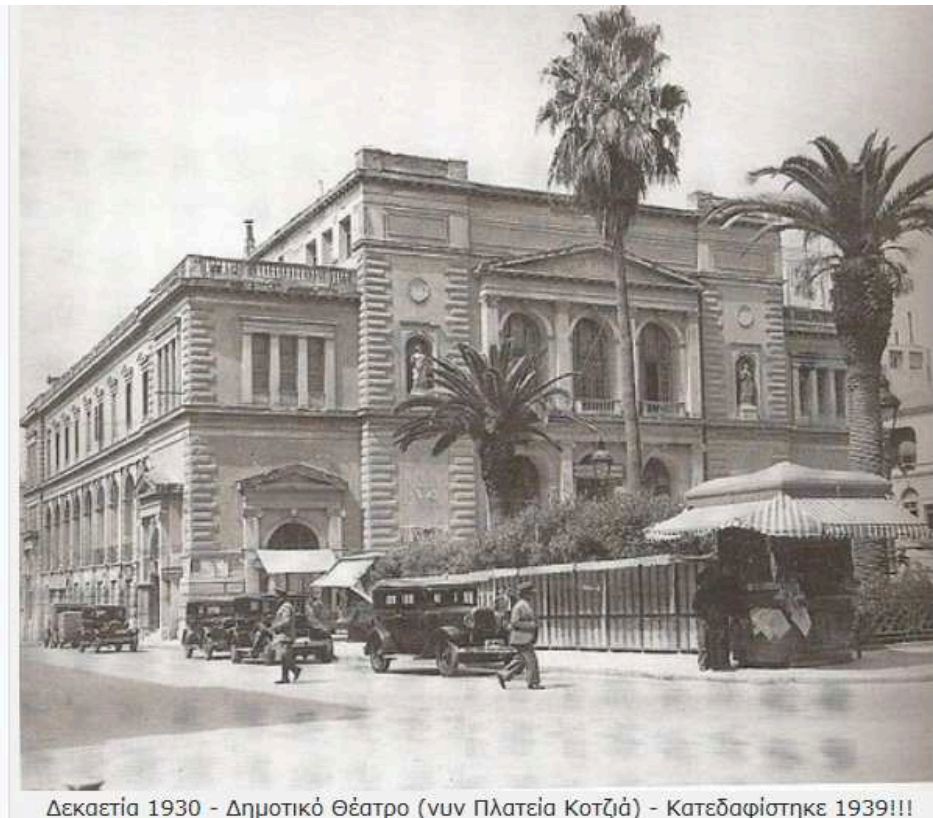
Δεκαετία 1930 - Δημοτικό Θέατρο (νυν Πλατεία Κοτζιά) - Κατεδαφίστηκε 1939!!!